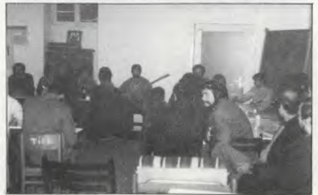
Köln TİDB yeni lokalinin açılış toplantısından